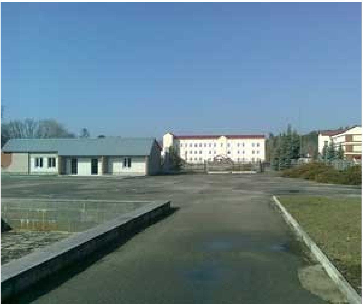
Площа перед спорудами біля 300 м 2 .