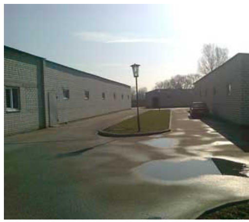
Тротуари (доріжки) з асфальтним покриттям.

Тротуари розраховані для безперешкодного під'їзду та проїзду по території легкового транспорту (та мікроавтобусів) що робить їх також зручними для виставкового обладнання.