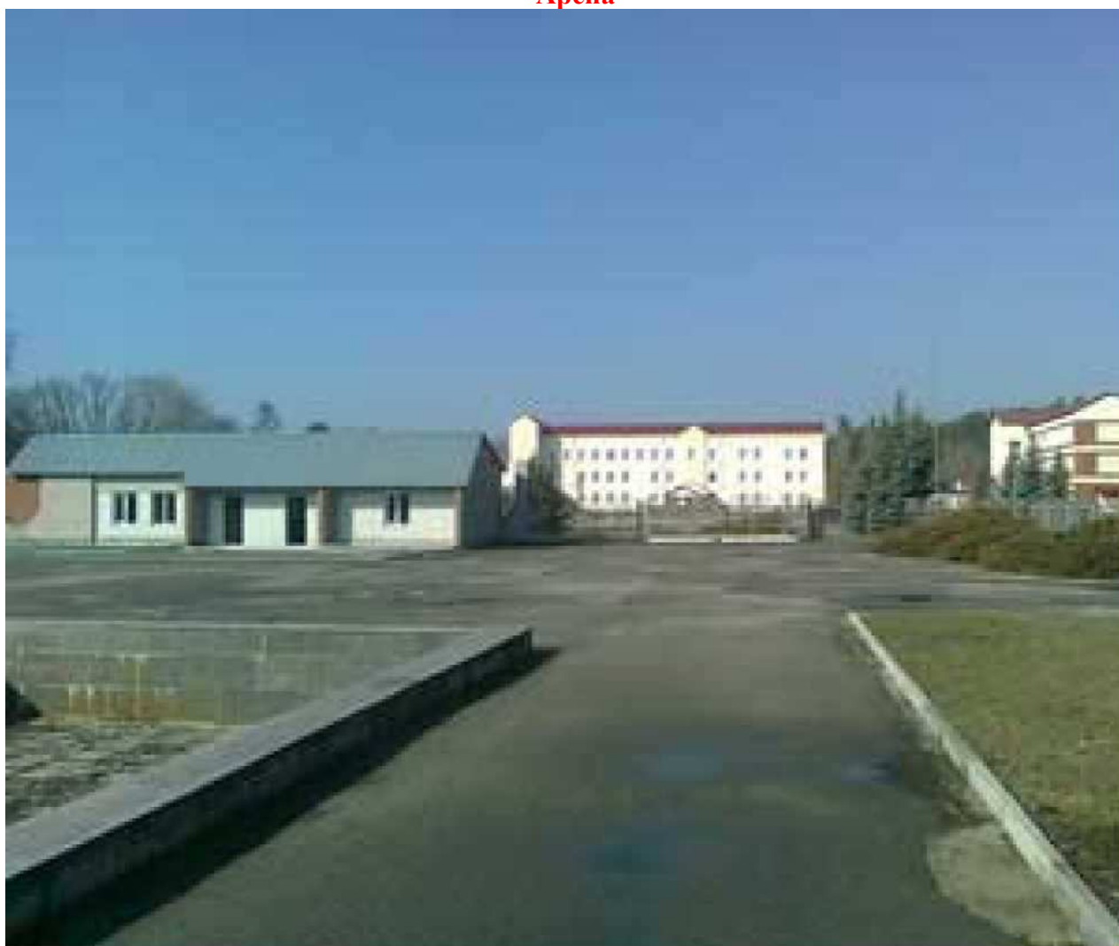
Площадь перед сооружениями около 300 м