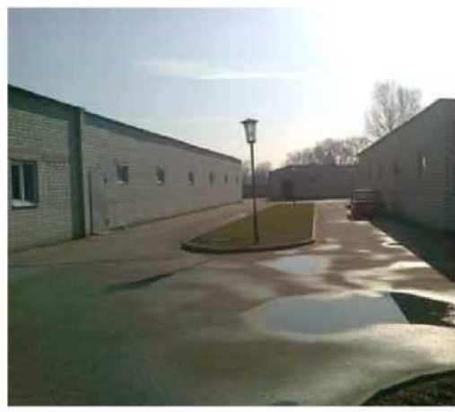
Тротуары (дорожки) с асфальтным покрытием.

Тротуары рассчитаны для беспрепятственного подъезда и проезда по территории легкового транспорта (и микроавтобусов) что делает их также удобными для выставочного оборудования.