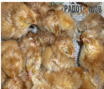
Рис 3. Курчата 3 категорії ( слабі та каліки)