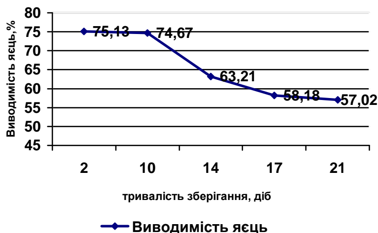
Рис.1 Динаміка змін інкубаційних показників яєць в залежності від терміну зберігання яєць