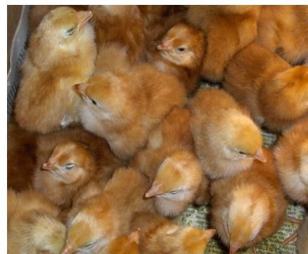
Рис 4 . Добові курчата 1 категорії