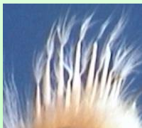
Курочки - швидке опереність