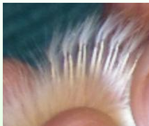
Півники - повільне опереність