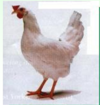
Материнська форма: білий легорн з геном "К"