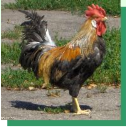
Батьківська форма: Золотистий легорн