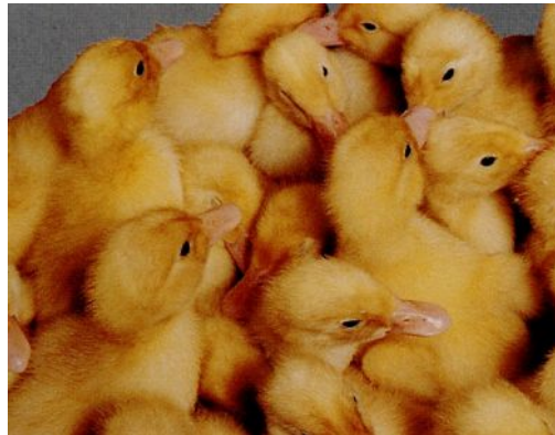
Рис. 25. Качки та каченята пекінської породи