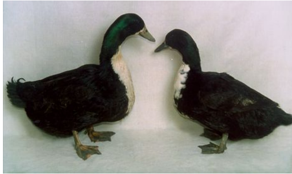
Рис. 28. Качки української чорної білогруді порідної групи

тулуба, на них є "дзеркало" із зеленуватим або фіолетовим відливом; ноги чорні або темно-коричневі; очі чорні; шкіра біла ( Y ); хвіст піднятий; шкаралупа яєць біла ( g ) (рис. 28).