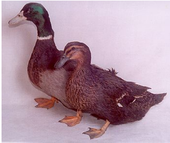
Рис. 26. Качки української сірої порідної групи

Показники продуктивності: жива маса дорослих селезнів – 3,3 - 3,5 кг, дорослих качок – 3,0 - 3,2 кг; жива маса каченят у 7-тижневому віці – 2,6 – 2,8 кг; несучість самок за 21 тиждень продуктивного періоду – 99-110 яєць; маса яєць – 69 - 74 г; вивід каченят – 69-76 %.