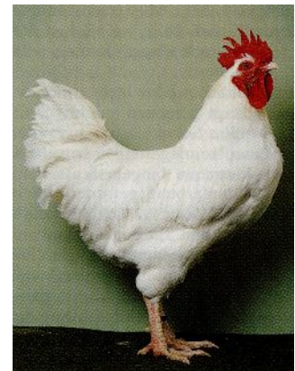
Рис. 5. Півень породи род-айленд білий