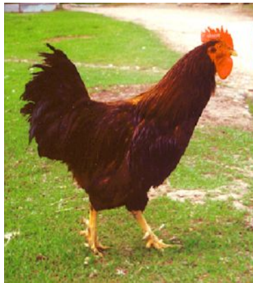
Рис. 4. Півень породи род-айленд червоний

Історія створення порід червоний та білий род-айленд. Порода род-айленд червоний виведена в середині XIX століття в штаті Род-Айленд (США) при схрещуванні місцевих курей із палевими кохінхінами і червонобурими малайськими курми (рис. 4). Зараз в Україні порода представлена лініями різних селекційних фірм світу, які використовуються як батьківські форми при одержанні 4-лінійних фінальних гібридів ("Ломанн коричневий", "Хайсекс коричневий", "Хай Лайн коричневий", "Іза браун" та ін.).