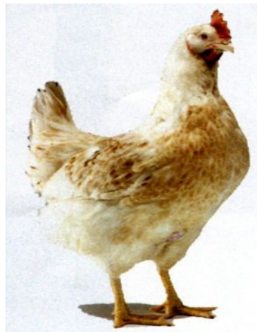
Рис. 3. Гібридна несучка кросу Ломанн Сенді

Забарвлення оперення несучки – брудно-біле з коричневими плямами (рис. 3).