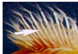
Курочки - швидке оперення (махове пір'я крила довше)