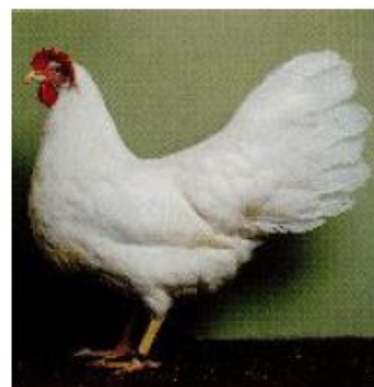
Рис.1. Півень та курка породи леггорн білий

Структура кросів. Всі імпортовані кроси яєчних курей породи леггорн білий створені на 4-лінійній основі (рис.2).