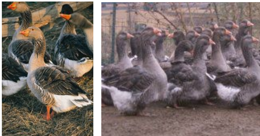
Рис. 34. Гуси тулузької породи

ПЗ: СТОВ „Агропроменерго” ("Племзавод Україна"), вул. Жукова 1, с. Знаменівка, Новомосковський р-н, Дніпропетровська обл., 51280, тел. (05693) 75152, 44475.