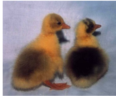
Рис. 30. Гуси популяції велика біла: дорослі та добовий молодняк

Показники продуктивності. Генетичний потенціал несучості за рік становить 56 - 60 яєць; маса яєць - 170 г. Жива маса у 52-тижневому віці: самців – 7,2 кг, самок – 6,5 кг. Жива маса гусенят у 9 – тижневому віці – 4,2 – 4,5 кг. Вивід гусенят – 70-75%. Гуси відзначаються високим виходом перопухової сировини прижиттєвого обскубування – 120 г/гол.