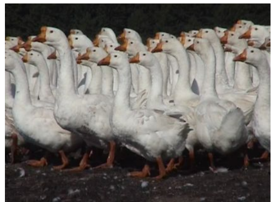
Рис. 35. Гуси породи ліндовська

ППР-2 : 1. СТОВ „Агрофірма Росток”, Нікопольський р-н, Дніпропетровська обл., тел.(05662) 76346, 76282.