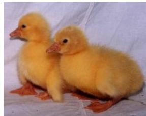
Рис. 31. Гуси породи рейнська біла: дорослі та добовий молодняк

Показники продуктивності. Генетичний потенціал несучості за цикл становить 45 - 50 яєць, за два цикли 60-80 штук. Маса яєць – 160-170 г, забарвлення шкаралупи біле. Жива маса у 52-тижневому віці: самців – 6-7 кг, самок – 5,5-6,5 кг. Вивід гусенят – 65-70%. Жива маса гусенят у 9 – тижневому віці – 3,7-4,0 кг, збереженість гусенят 94 – 95%. В Інституті птахівництва УААН разом зі спеціалістами ДППП "Роздольне" Харківської області гуси рейнської породи були використані при створенні нової вітчизняної популяції гусей - великих білих.