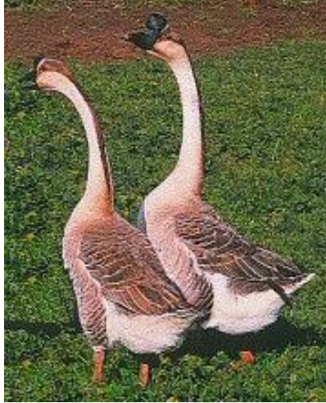
Рис. 32. Гуси породи кубанська сіра

Історія створення. Сучасна порода гусей створена співробітниками кафедри птахівництва Кубанського сільськогосподарського інституту шляхом зворотного схрещування горківських гусей з китайськими (рис.32).