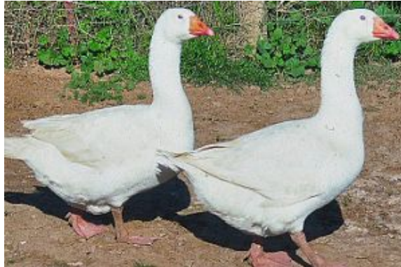
Рис. 33. Гуси породи легарт

Показники продуктивності: жива маса дорослої птиці: самців – 7,5-8,0 кг, самок – 6,5-7,0 кг, генетичний потенціал несучості сягає 25-33 яєць за рік, маса яєць – 180-190 г, вивід гусенят – 60-65 %, жива маса гусенят у 9-тижневому віці: 4,5-4,9 кг.